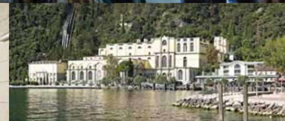
Riva del Garda

Visita le centrali idroelettriche del Trentino e scopri come l'acqua si fa energia. Attraverso percorsi inediti e simulazioni interattive, potrai ammirare da vicino autentici gioielli d'architettura e stupefacenti opere d'ingegneria, custodi della storia di intere generazioni e di uno straordinario territorio. Hydrotour Dolomiti. Un'esperienza sorprendente, unica in Italia.